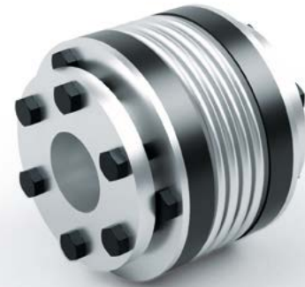
Fig. 1: BK3-200-78 | Metal Bellow Coupling