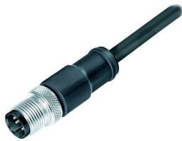
Anschlussleitung-Stecker-5pol-M12-gerade (2m oder 5m) Connection cable-male-5pin-M12-straight (2m or 5m)